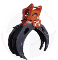
Захват для брёвен